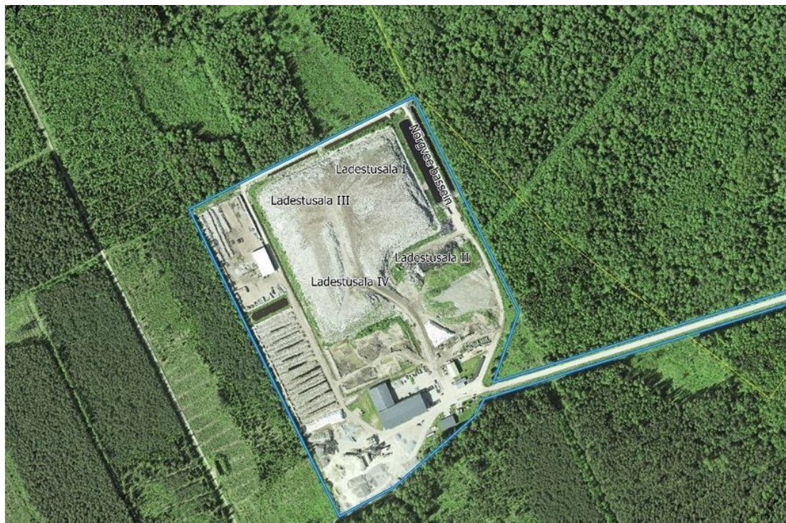
Uikala prügila skeem (Allikas: KMH programm joonis 1, 03.02.2023)

KMH viiakse läbi keskkonnakompleksloa (tegevusloa) andmise üle otsuse tegemiseks, sh loatingimuste määramiseks. KMH käigus hinnatakse kavandatava tegevuse ja selle alternatiivide mõju keskkonnale, tuuakse välja selle olulisus ning võimalikud leevendusmeetmed negatiivse mõju vähendamiseks või vältimiseks. Keskkonnamõju hindab KMH juhteksperit ja eksperidirühm koos arendajaga.